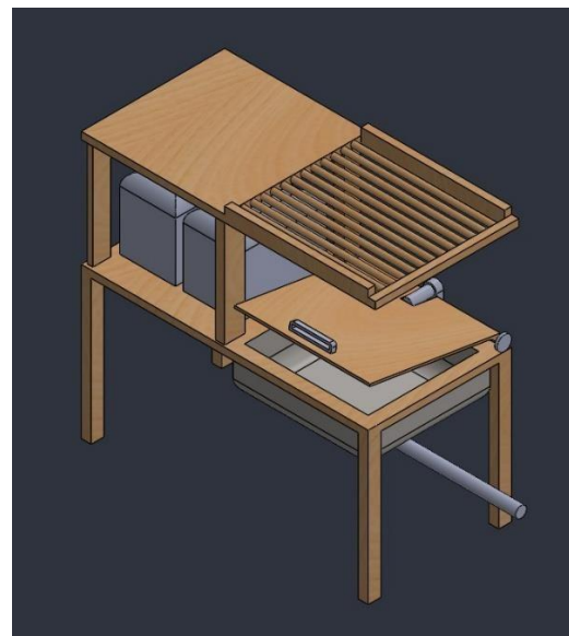
Gambar 2. Tempat pencucian, penirisan dan pemotongan

Kegiatan transportasi ini sebenarnya dapat dikurangi dengan memindahkan tempat pencucian, tempat pengeringan sementara dijadikan pada satu tempat dan mendekatkan posisi pemotongan dengan tempat pengeringan sementara. Pemindahan lokasi dapat menghemat kegiatan bolak balik dan sekaligus mengurangi jarak tempuh untuk memindahkan bahan-bahan yang akan diolah. Relayout ini dapat dilakukan pada ukuran ruangan 4 \times 2,5 \text{ m}^2 dengan cara memindahkan tempat pencucian dan pemotongan yang sekarang berada di luar ruangan produksi dengan merancang alat tempat pencucian, pengeringan/penirisan sementara dan tempat pemotongan pada satu area. Rancangan alat tersebut dapat dilihat pada Gambar 2.