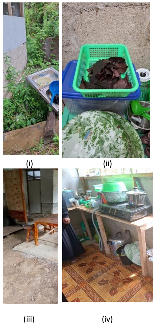
Gambar 1. Area produksi minuman herbal (i). Tempat pencucian bahan herbal, (ii) wadah penirisan yang telah dicuci, (iii) meja tempat pemotongan bahan herbal, (iv) ruangan dapur untuk merebus obat herbal

Panjangnya dan berbeloknya aliran proses ini akan berpengaruh pada waktu proses, terjadinya jarak tempuh yang dialami oleh produk yang panjang dan memerlukan alat bantu pemindahan bahan baku ( material handling ). Hal-hal tersebut juga akan berpengaruh dan efisiensi produksi. Diharapkan nanti dengan pengaturan layout fasilitas akan memperpendek waktu siklus proses, mengurangi material handling dan meningkatkan output.